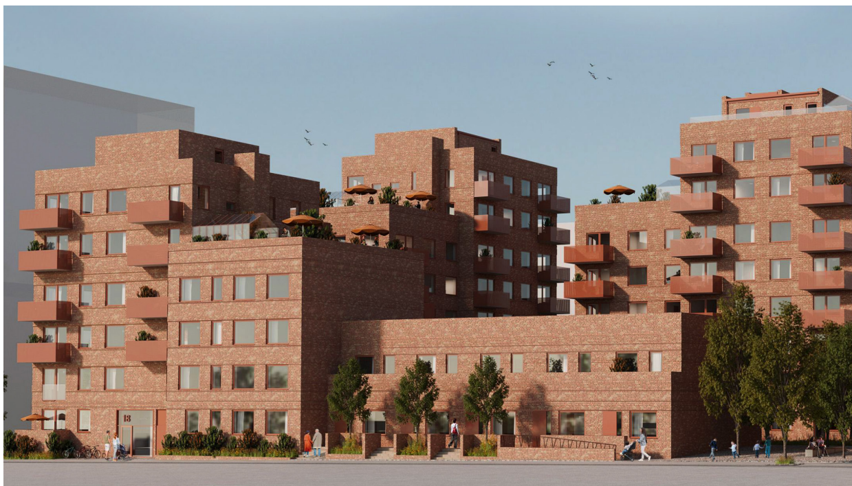
Visionsbild: Larsson Arkitekter