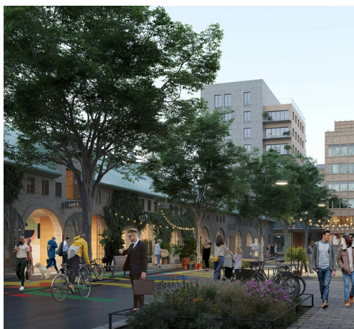
Visionsbild: Nyréns Arkitektkontor

Slakthusområdet utvecklas just nu till en av Stockholms mest spännande stadsdelar. Här möts nya bostäder, arbetsplatser, kultur och restauranger i en unik historisk miljö. I renoverade industribyggnader finner du av en mix av street-food, fine dining och barer. Med tunnelbana, tvärbana och bussar runt hörnet samt Globenområdet på gångavstånd bor du nära både stadspuls, service och grönska. En modern, levande stadsdel där allt finns inom räckhåll.